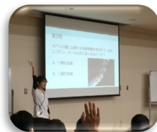
都祁中学校「禁煙教室」(2018.11)