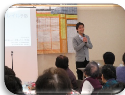
都祁交流センター新春ふれあい交流会「フレイル予防」(2019.1)

◆都祁診療所は、 健康教室や地域の会議など 、 住民の皆さまとの交流を積極的に行いたい と考えています。交流の機会やご要望があれば、お気軽にお声かけください(0743-82-1411)。